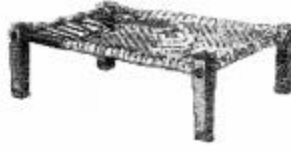
‘चारपाई’ के नीचे