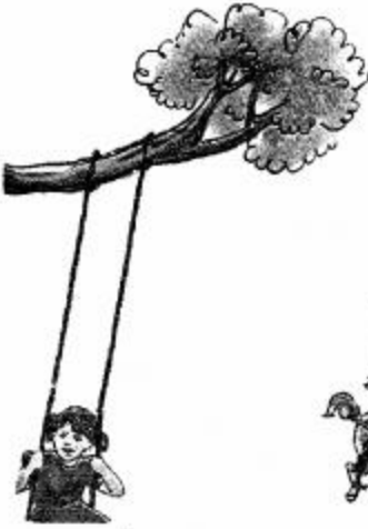
घर का आँगन