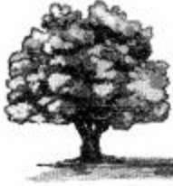
‘पेड़’ के पीछे