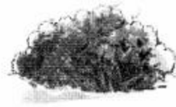
‘झाड़ी’ के पीछे

नोट-बच्चों के चित्र विद्यार्थी स्वयं बनाएँ।