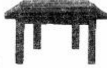
‘मेज़’ के नीचे